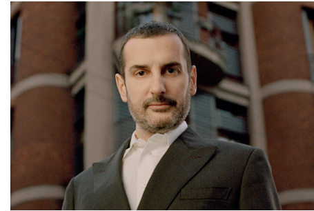
Costantino della Gherardesca